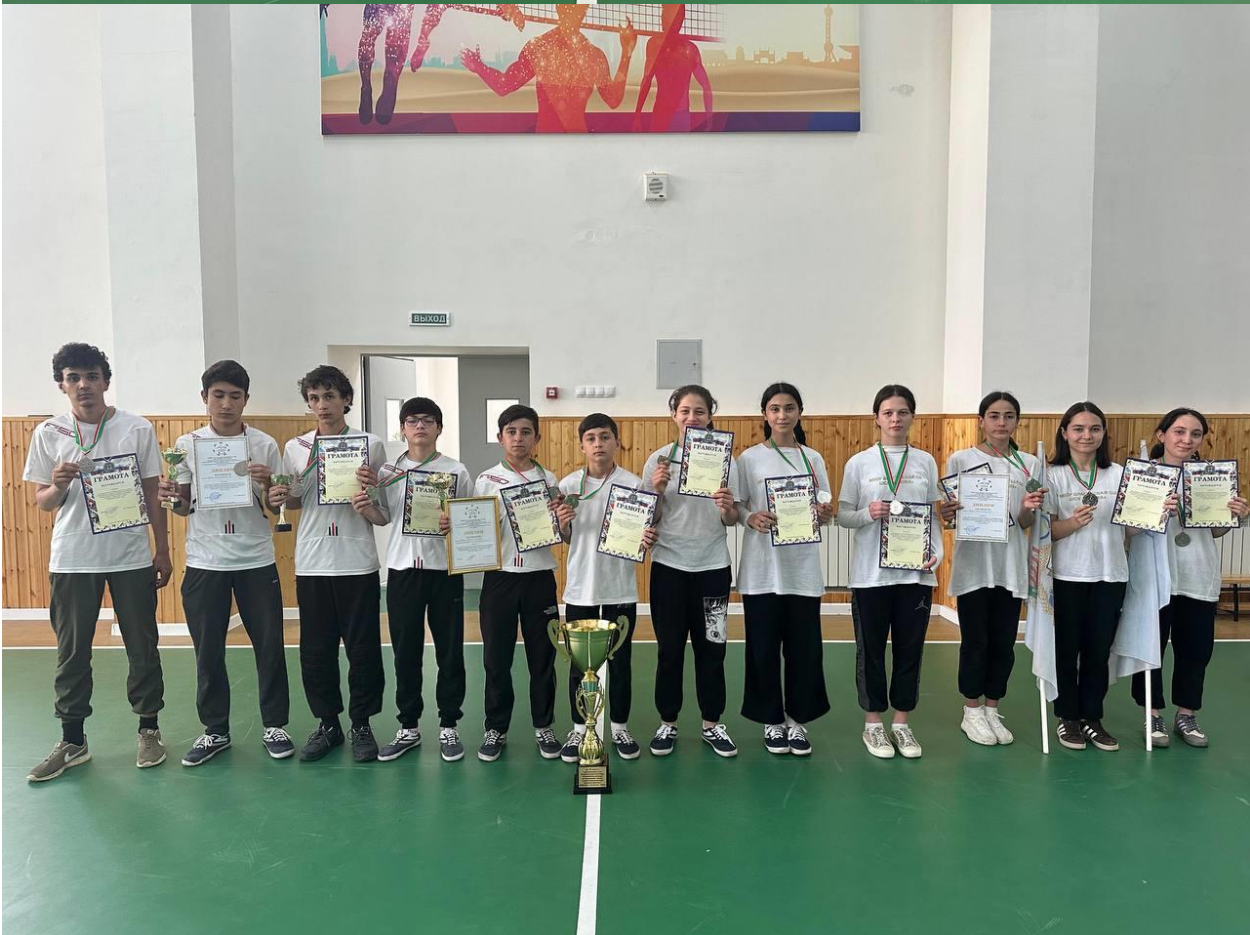
Муниципальный этап «Веселые старты» -2 место