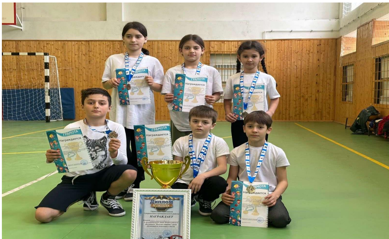
Президентские игры муниципальный этап- 2 место