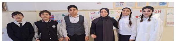
Игра между 5 ми классами " Easy English"