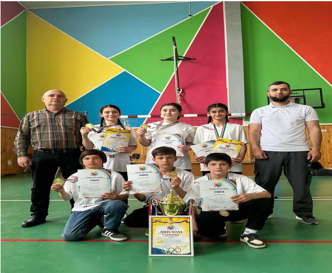
Команда МБОУ "Брагунская СШ" заняла 1 место легкоатлетических соревнованиях районного этапа среди общеобразовательных учреждений Гудермесского муниципального района.