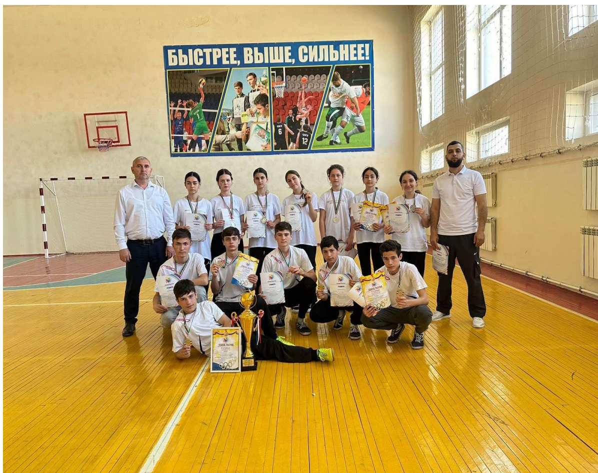
Президентские состязания районный этап -1 место.