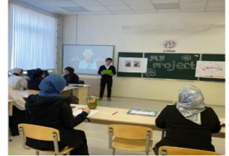
Брейн ринг между 7ми классами "Гарри Поттер в школе Хогвардс"