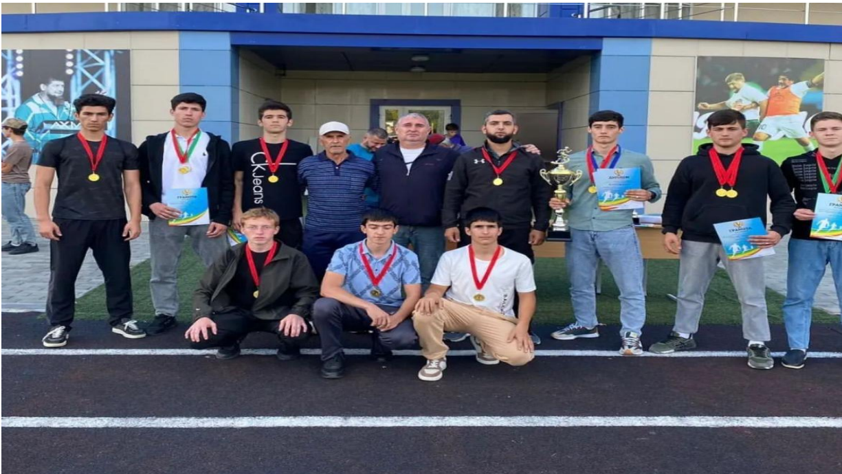
Лига по волейболу районный этап 2 место.